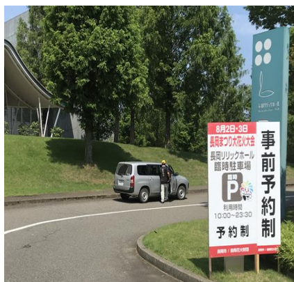
長岡花火 公式駐車場