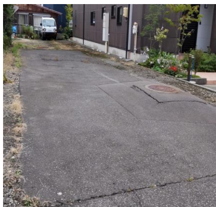
利根川花火 徒歩15分 5,000円/1台