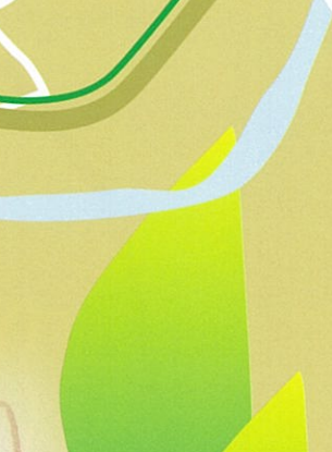
11 高瀬賢治句 盆地にも今日は別れの本野上 駅にひかれるたうきぎの穂よ 長瀬町と賢治の貴重な出会いの証を永く後世に伝え、町の教育文化の向上、観光発展のためにこの歌碑が建立された。