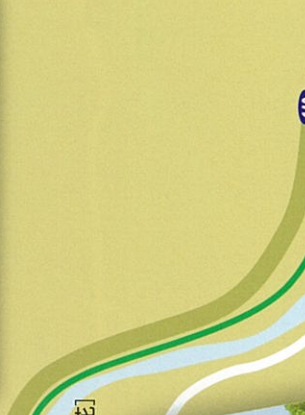
9 高浜虚子句 ここに我句を留むべき月の石 虚子句碑は長瀬町内に三基あり、最初に建立されたもの。