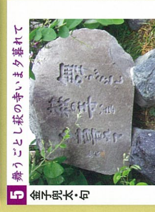
5 金子兜太句 舞うごとし萩の寺いまた夕暮れて 洞昌院は七草「萩」の寺。花盛りの時は各種の花に埋もれて美しい。