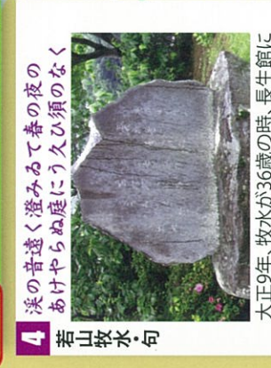
4 若山牧水句 淡の音遠く澄みわたる春の夜の あげやらぬ庭にう久ひ須のなく 大正9年、牧水が36歳の時、長生館に泊まり翌朝岩畳を散策した。六百もの一首で、歌集「くろ土」に所収されている。