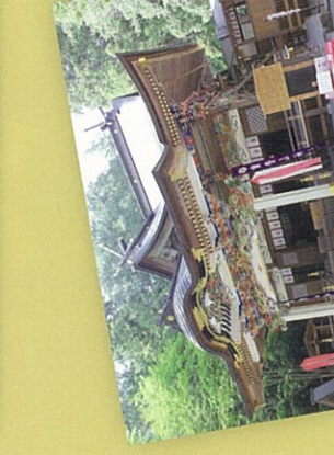
7 金子兜太句 谷間谷間に満作か咲く荒凡夫 宝登山神社は秩父三社の一つ。金子伊昔紅・兜太・千侍父子三人の句が並ぶ。