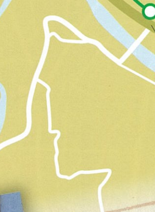
10 高瀬賢治句 つづくくと「粋なもやうの博多帯」 荒川ぎしの片岩のいろ 秩父地方の土壌地質調査に訪れた長瀬で虎岩を見てその美しさを詠んだもの。保阪嘉内に宛てた葉書の九首の中の一首。