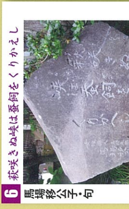
6 萩咲きぬ味は蚤飼をくりかえし 馬場移公字句 馬場移公字句は金子伊昔紅に学び、長瀬町が生んだ女流俳人。