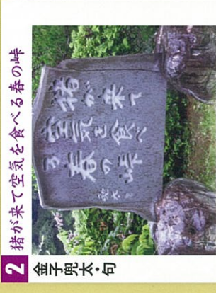
2 金子兜太句 猪が来て空気を食べる春の峠 兜太の句碑として長瀬町に於ける四基目となるもの。